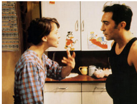
1990 L'ENTRAÎNEMENT DU CHAMPION AVANT LA COURSE de Bernard Favre avec Richard Berry