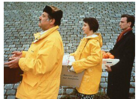
1992 LA SÉVILLANE de Jean-Philippe Toussaint avec Jean Yanne, Jean-Claude Adelin