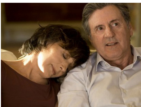
2015 NOS FEMMES de Richard Berry avec Daniel Auteuil