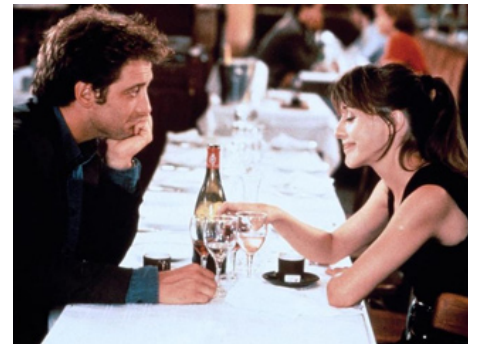
1991 NETCHAÏEV EST DE RETOUR de Jacques Deray avec Vincent Lindon