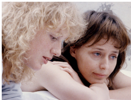
1991 J'ENTENDS PLUS LA GUITARE de Philippe Garrel avec Johanna Ter Steege