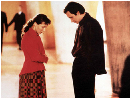
1989 UN MONDE SANS PITIÉ d'Éric Rochant avec Hippolyte Girardot