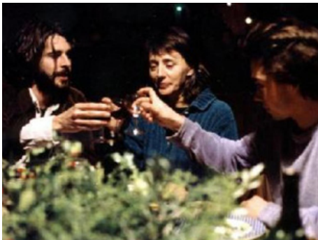
2003 LES MAINS VIDES de Marc Recha avec Jérémie Lippmann