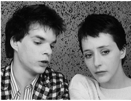
1984 BOY MEETS GIRL de Leos Carax avec Denis Lavant