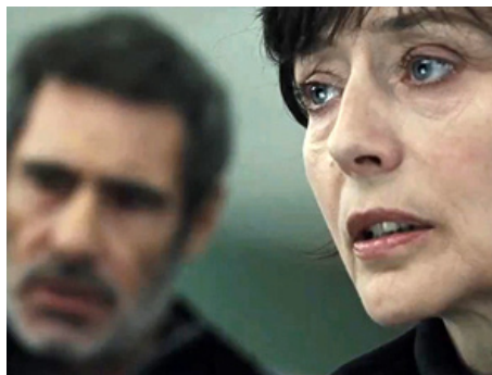
2010 À BOUT PORTANT de Fred Cavayé avec Gérard Lanvin