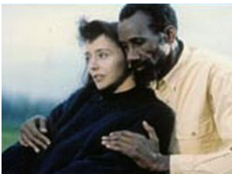
1992 GOLEM, L'ESPRIT DE L'EXIL d'Amos Gitai avec Sotigui Kouyaté