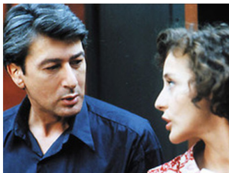
1993 L'OMBRE DU DOUTE d'Aline Issermann avec Alain Bashung