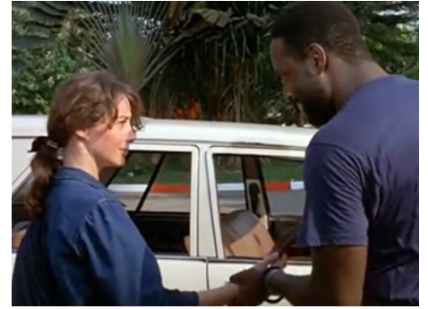
1988 CHOCOLAT de Claire Denis avec Isaach de Bankolé