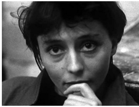
1985 ELLE A PASSÉ TANT D'HEURES SOUS LES SUNLIGHTS de Philippe Garrel