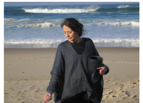
2013 SEUL LE FEU de Christophe Pellet