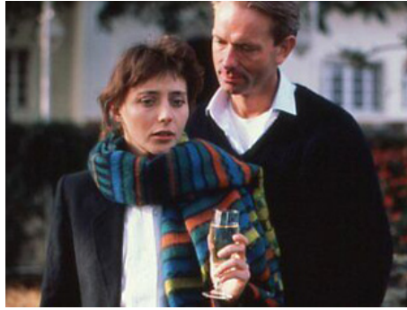
1986 JOUR ET NUIT de Jean-Bernard Menoud avec Peter Bonke